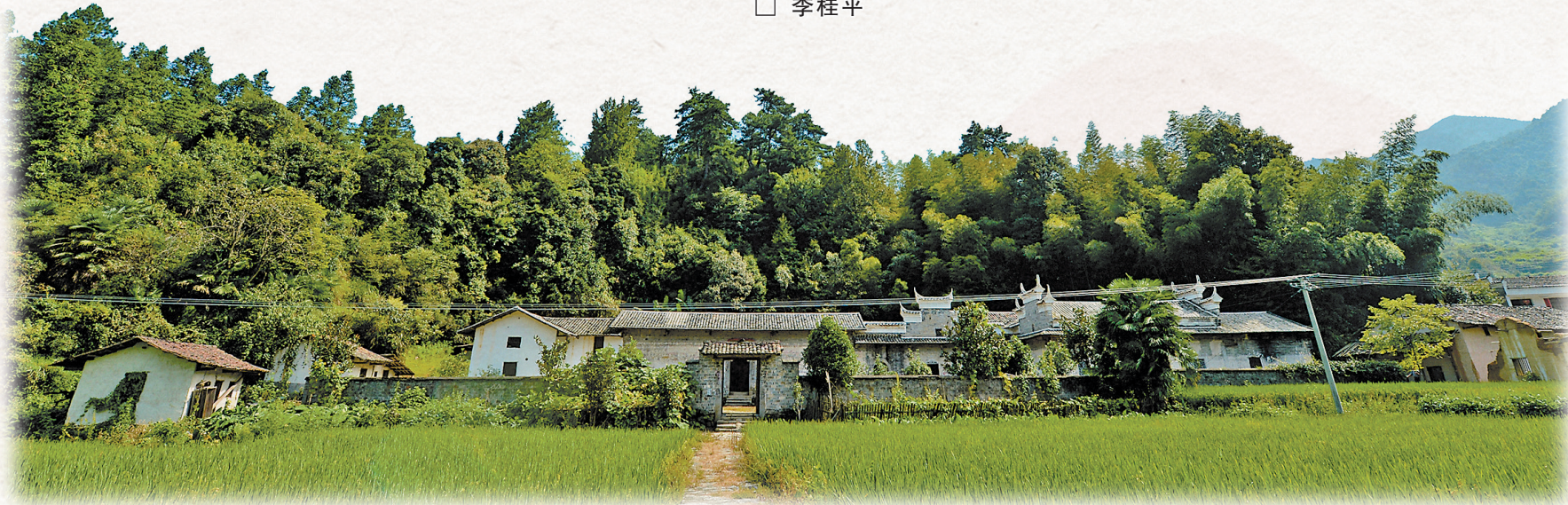
陈宝箴、陈三立故居