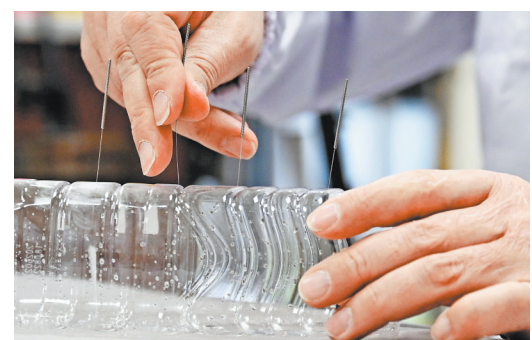
“洋中医”练习针刺手法。