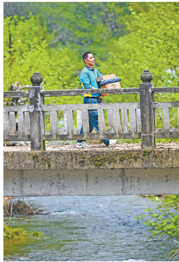
挨家挨户给村民送包裹。