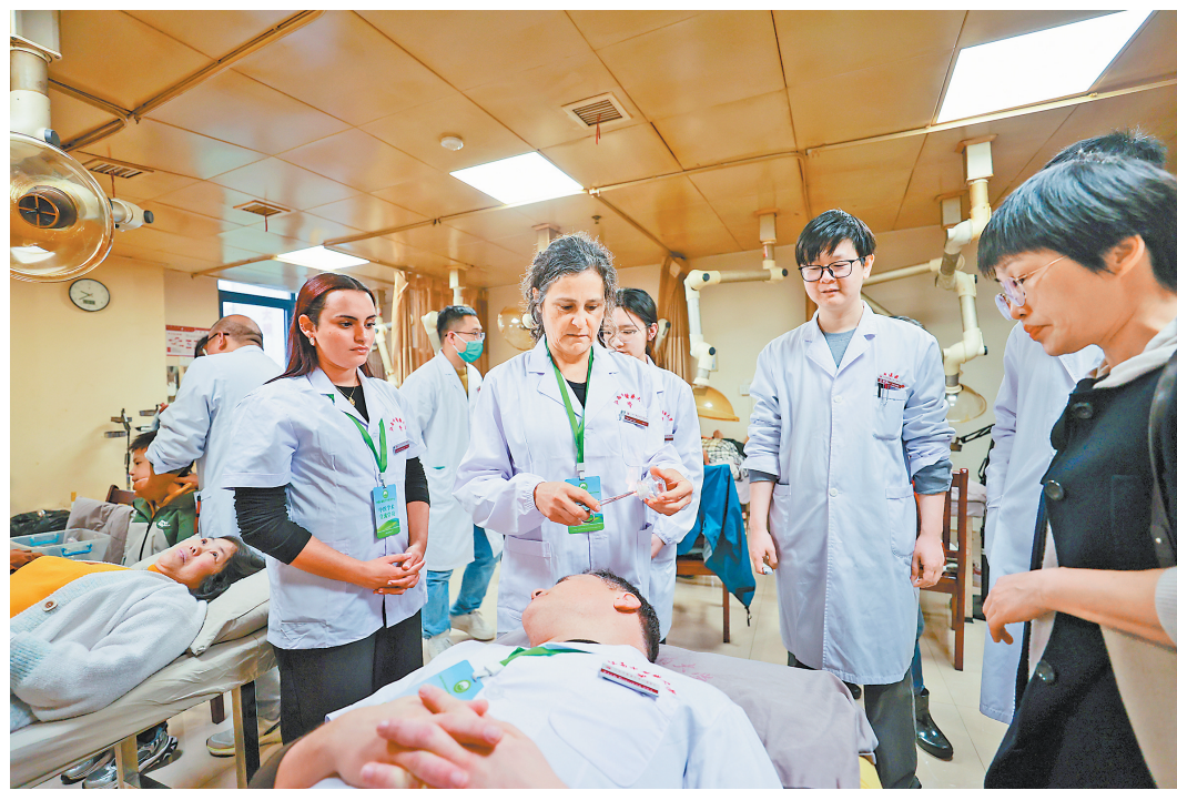
“洋中医”体验中医拔罐。