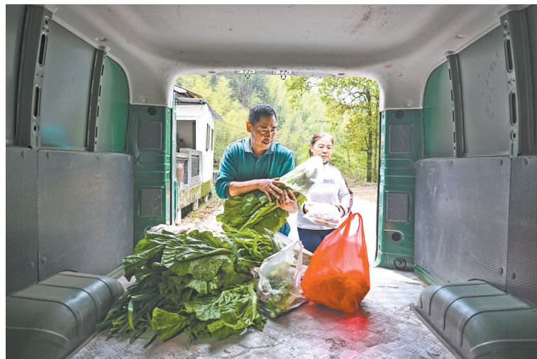
免费帮村民捎带蔬菜。