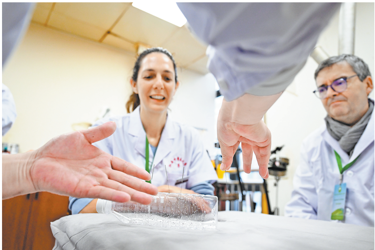
4月3日,江西中医药大学附属医院西湖院区,带教老师为“洋中医”示范针刺手法。