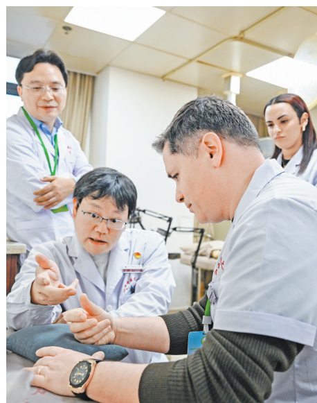
带教老师手把手教授推拿技法。

4月3日,江西中医药大学附属医院西湖院区治疗室内,艾草清香袅袅萦绕。来自葡萄牙的9名注册中医师正凝神屏息,跟随带教老师专注练习针刺手法。