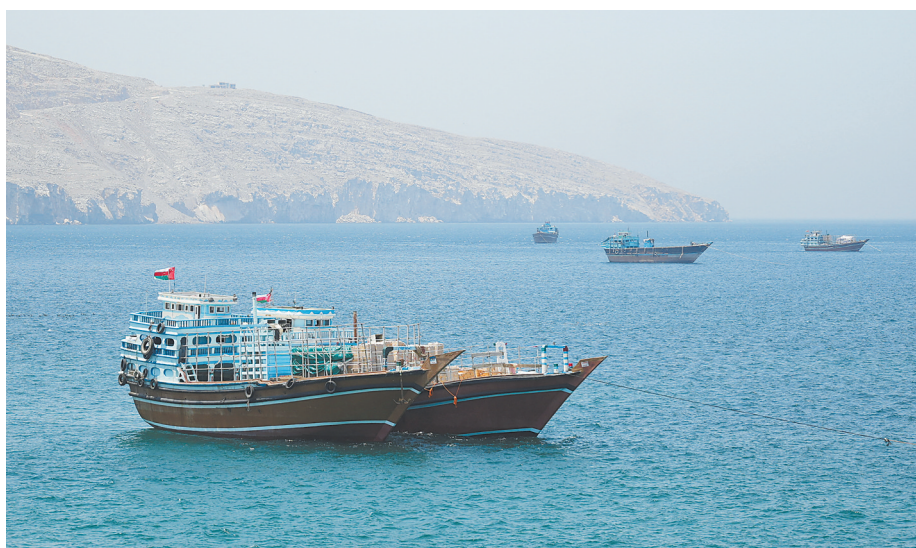
这是5月8日在阿曼穆桑代姆拍摄的霍尔木兹海峡上的船只。英国海事分析公司温沃德5月7日发布报告说，霍尔木兹海峡附近水域安全形势持续紧张，大量商业船只选择关闭船舶自动识别系统，转入“暗航”状态。

首先，围绕霍尔木兹海峡的摩擦会持续。分析人士认为，尽管美国仍有意重启“自由计划”以削弱伊朗对海峡的掌控，但伊朗在事实上已成为“霍尔木兹海