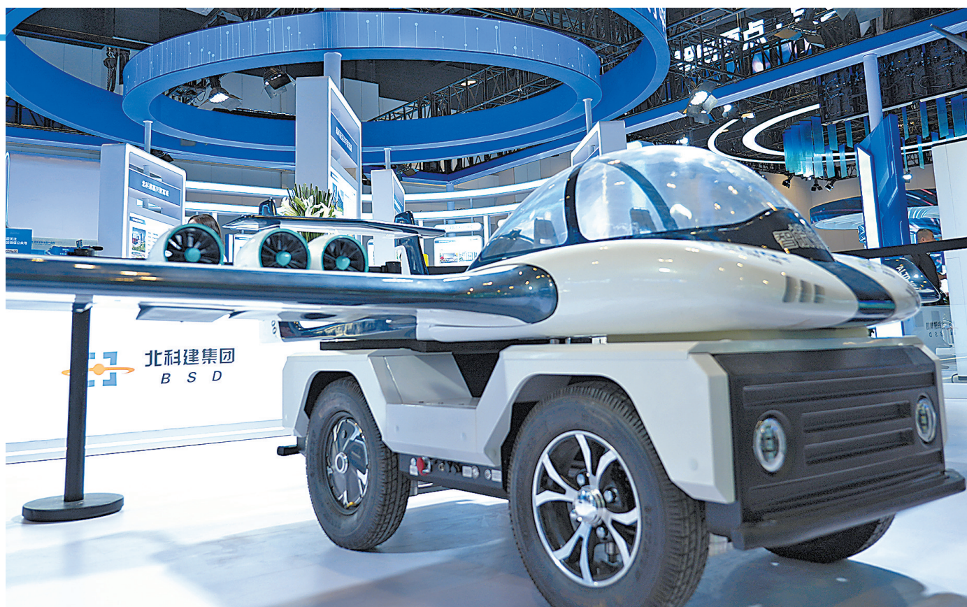
参展的一款飞行汽车。