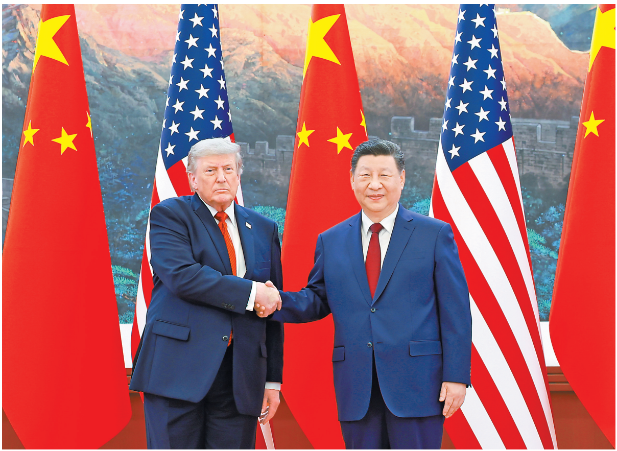
5月14日上午,国家主席习近平在北京人民大会堂同来华进行国事访问的美国总统特朗普举行会谈。