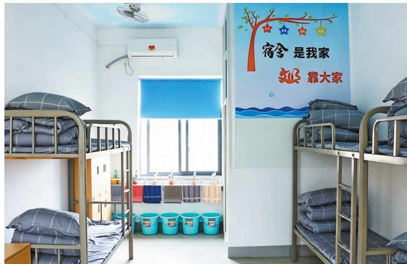
▲寮塘乡太平中学学生宿舍经温馨化改造后，空调、卫生间等设施一应俱全，整洁又温馨。