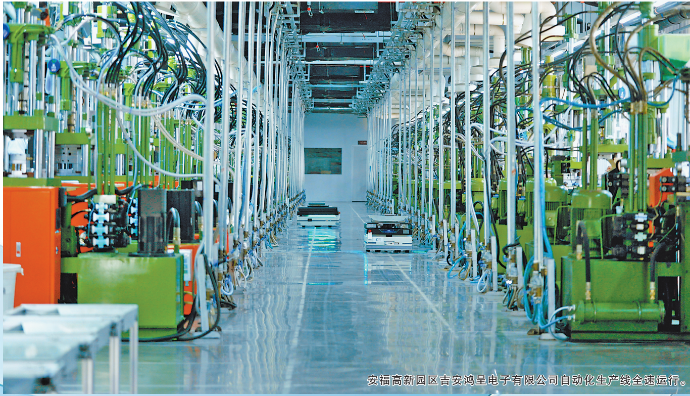
安福高新园区吉安鸿呈电子有限公司自动化生产线全速运行。

2025年，全县16个重点改革项目圆满完成，12项改革经验获评全国或全省典型；2026年开年以来，安福县锚定“十五五”开局目标，接续推进15项重点改革、39项核心任务。改革不停步，民生日日新。