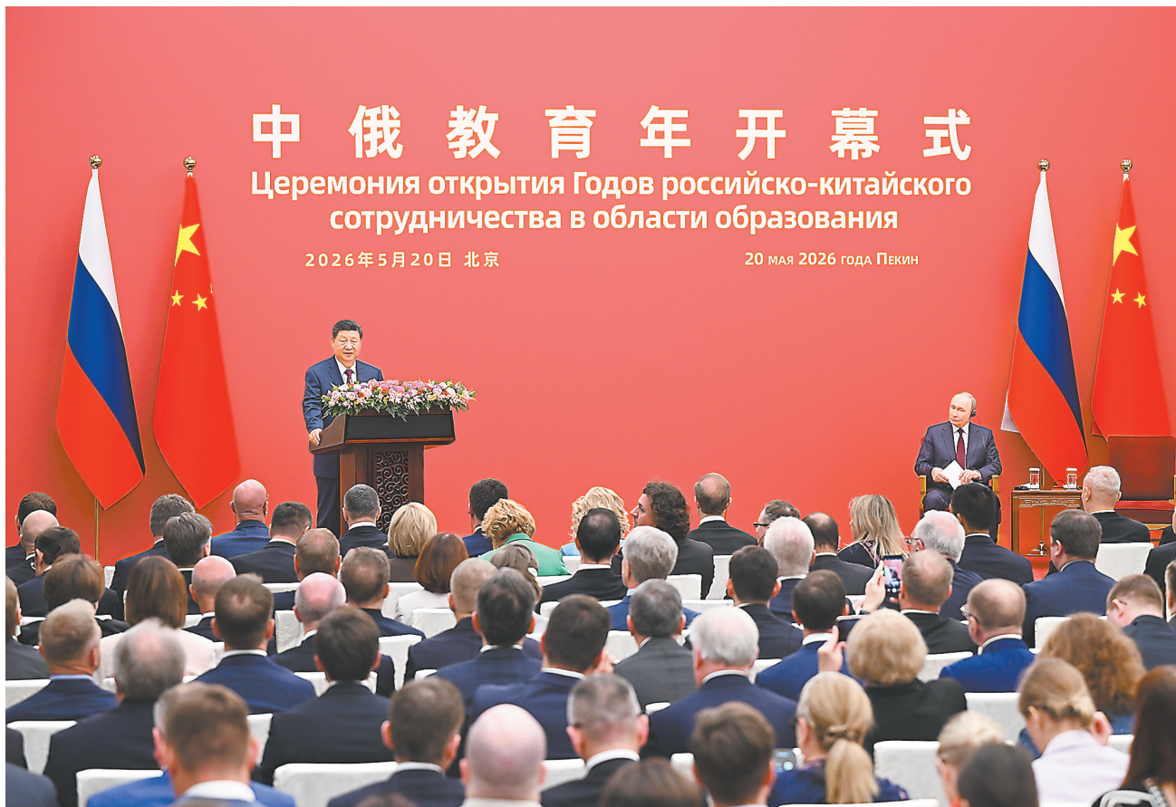
5月20日下午,国家主席习近平同俄罗斯总统普京在北京人民大会堂共同出席“中俄教育年”开幕式。

新华社北京5月20日电(记者杨依军、温馨)5月20日上午,国家主席习近平在北京人民大会堂同来华进行国事访问的俄罗斯总统普京举行会谈。两国元首一致同意《中俄睦邻友好合作条约》继续延期。