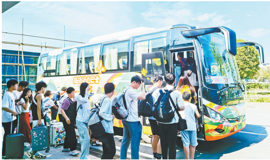
游客排队上“烟云号”巴士。

如果说城乡客运一体化解决了“通”的问题,那“烟云号”旅游站点巴士则破解了“优”的难题。去年1月,印有“烟云号”