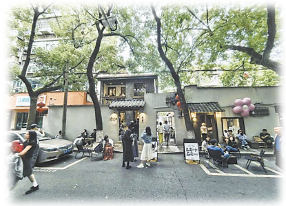
后墙里文化街区成为年轻人打卡热门地。