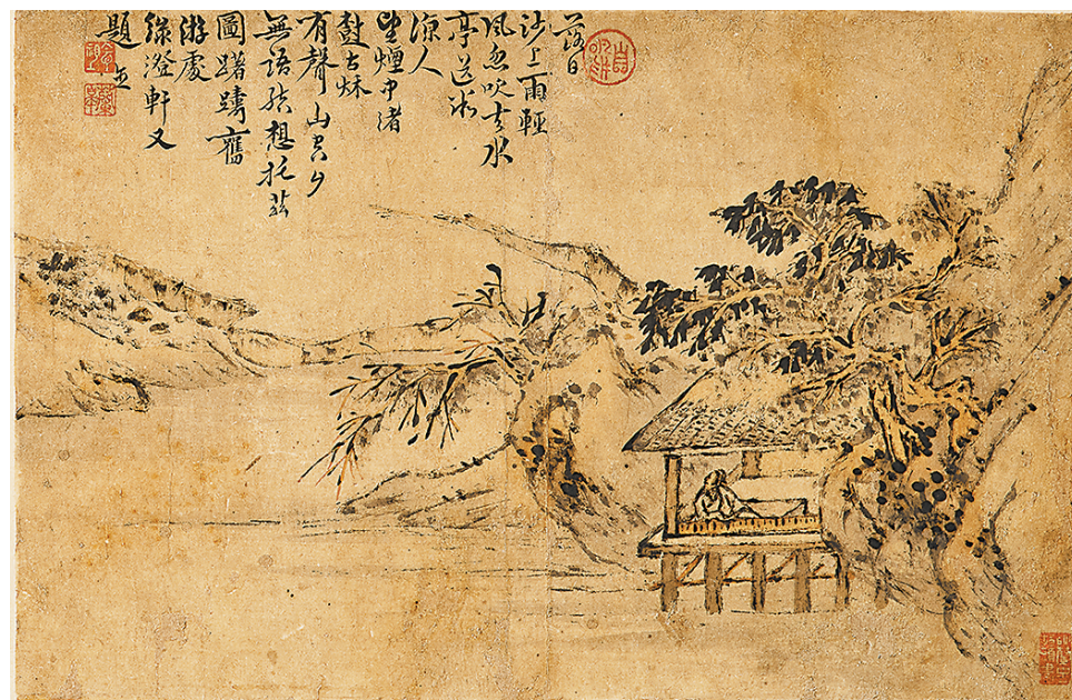
帅念祖书画册页(之一)