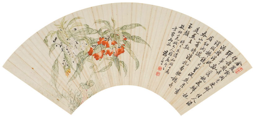
《凤仙花图》汤世澍绘