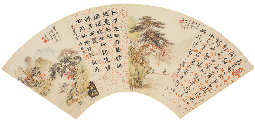
格景书画 汪琨等绘、书