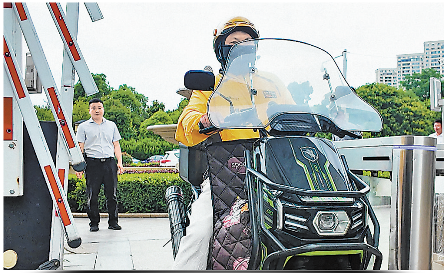
外卖小哥凭订单秒入小区。