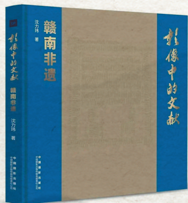
《影像中的文献：赣南非遗》 沈力玮 著 中国摄影出版社

《影像中的文献：赣南非遗》是一场视觉盛宴，是一部融合了文献考据、田野调查、影像叙事的作品。作者通过他的镜头和文字，不仅为我们保存了赣南六项珍贵非遗的生动样貌，更完成了一次意义深远的