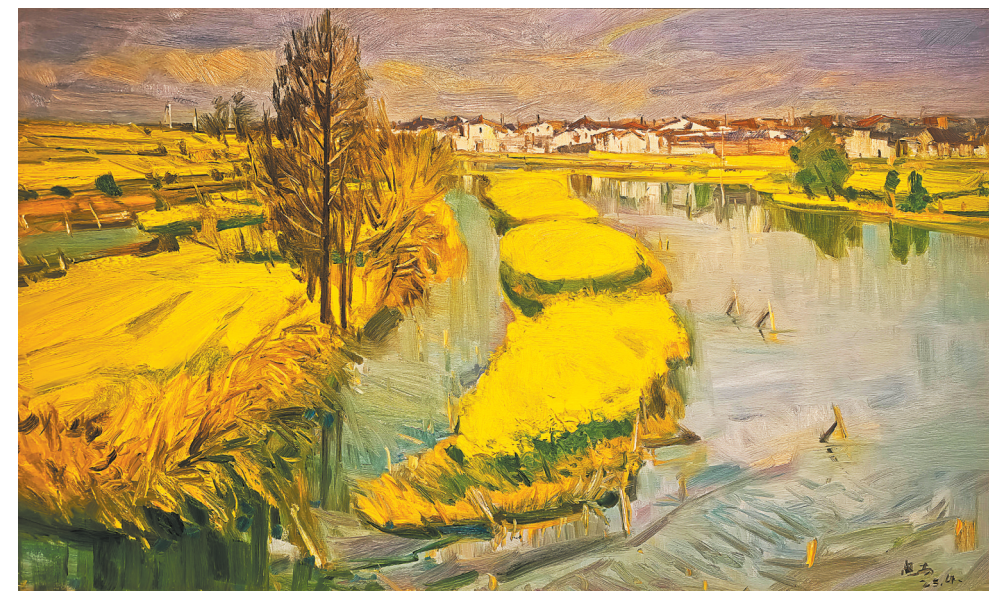
油画《碧水花田》范迪安绘