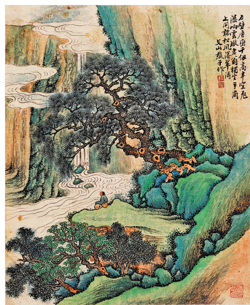
魏鹤年山水册页(之一)