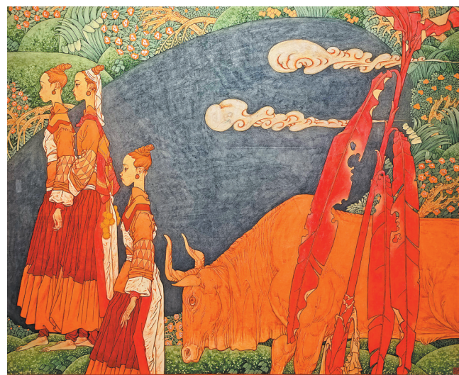
国画《溪山晓行》陈孟昕绘