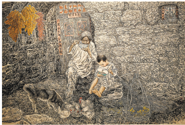
国画《家园》王有政绘