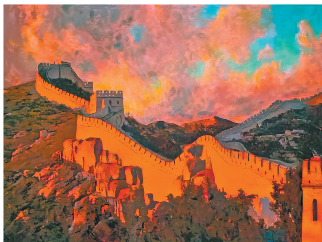
油画《长城》潘义奎绘