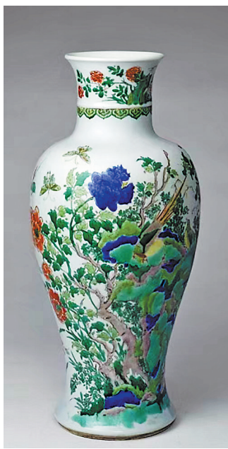
图2:清代五彩雉鸡牡丹图瓶

五彩雉鸡牡丹图瓶(图2)，是清代康熙年间的瓷器珍品，现藏于北京故宫博物院。此瓶高45厘米，口径12.3厘米，足径14厘米，撇口、直颈、丰肩、垂腹、圈足，造型端庄古朴，线条流畅自然。瓶身以五彩装饰，颈部绘洞石菊花纹。腹部主题为“洞石雉鸡牡丹图”：一只色彩绚丽的雉鸡立于洞石之上，牡丹盛开其间，彩蝶飞舞。画面生动饱满，充满生机。瓶身上牡丹与雉鸡组合蕴含吉祥祈福之意，体现了清代瓷绘牡丹纹饰的写实风格。