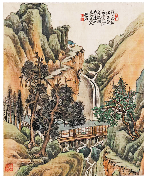
魏鹤年山水册页(之二)

最后，需要指出的是，也许魏鹤年耽于精工细作的青绿山水及此品类的大制作，其写意水墨类的应酬之作倒显得有些拘谨，并不出彩。这也是笔者所见其多方面作品之后的一个观感。但这并不重要，因为一位画家要能做到这般精工已非易事，想当年王希孟也就画完一幅《千里江山图》，便“下落不明”。