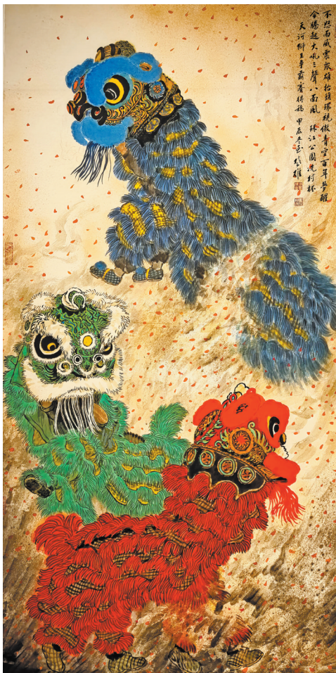
国画《东方雄狮》方楚雄绘