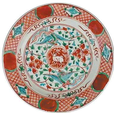
图1:明嘉靖红绿彩凤穿牡丹纹盘

明代饰有牡丹纹饰的器物较多，和元代相比，这些器物的构图更加疏朗大气，纹饰所留的空间较大。描绘牡丹时，大多是正面、半侧面和侧面的角度，在写实纹样的基础上，牡丹花瓣渐趋圆润，还有细