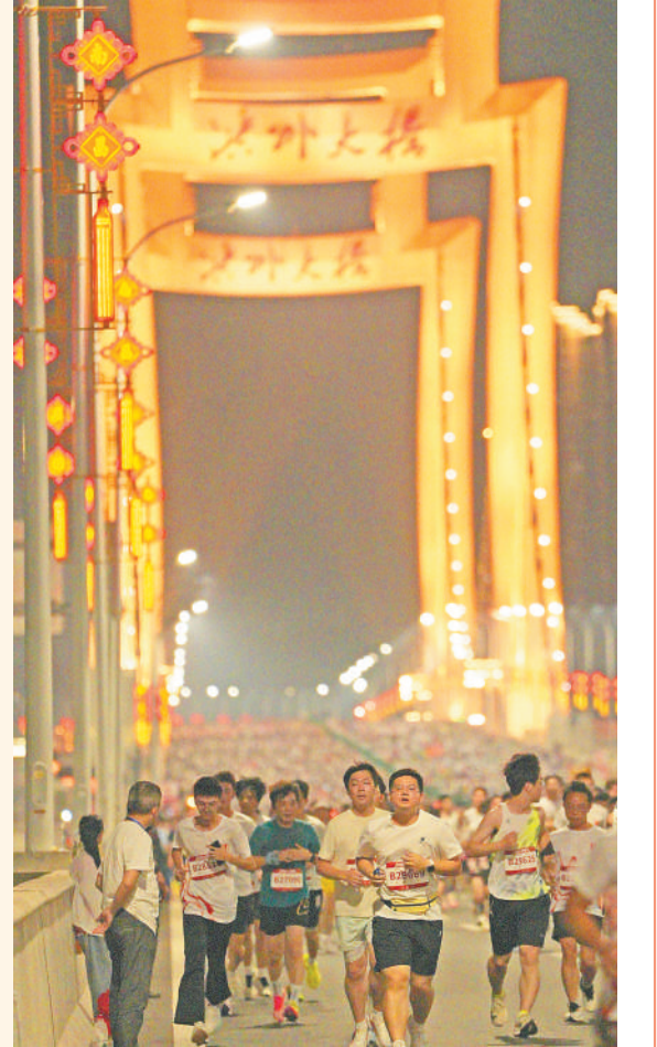
“爱我英雄城·夜跑洪州桥”2026南昌万人夜跑活动参赛者奔跑在洪州大桥上

万人夜跑活动的顺利举行,离不开细致周到的赛事保障。本次赛事中,南昌县承担了起终点搭建、沿线安保、交通接驳、志愿者服务、啦啦队组织等多项核心工作。从地铁4号线东新站开出的接驳摆渡车不间断运送跑者,赛道沿线设置医疗点、饮水站,移动AED和急救车全程跟随,确保每一名跑者安全、顺畅地完成挑战。