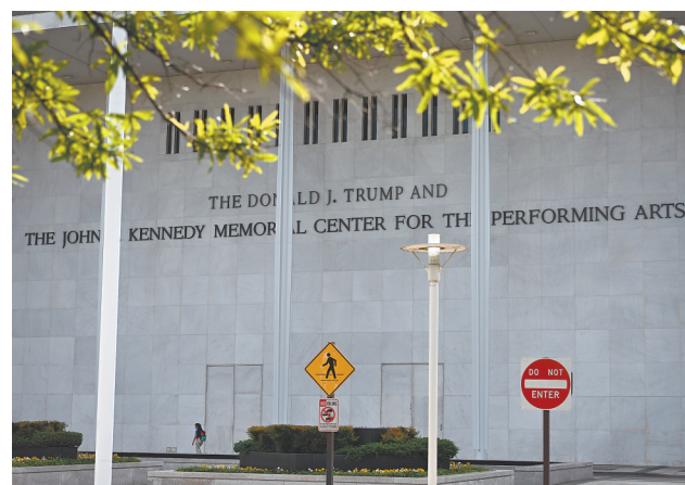
这是6月1日在美国华盛顿拍摄的肯尼迪表演艺术中心。美国哥伦比亚特区联邦地区法院法官5月29日裁定将美国总统特朗普的名字从肯尼迪表演艺术中心移除,以及中止该中心关闭两年以进行翻修的计划。