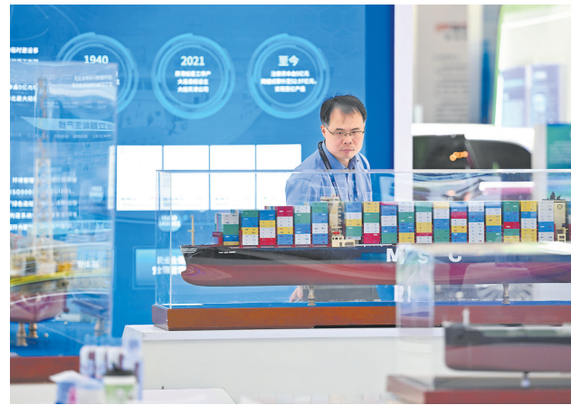
6月2日,与会嘉宾在博览会港航与海工装备展区参观。6月2日,第四届天津国际航运产业博览会在国家会展中心(天津)开幕。本届博览会以“畅通天下 运行未来——AI引领港航发展新机遇”为主题,展览面积达5万平方米,设置4个展厅,参展企业超400家,预计观展人数超6万人次。