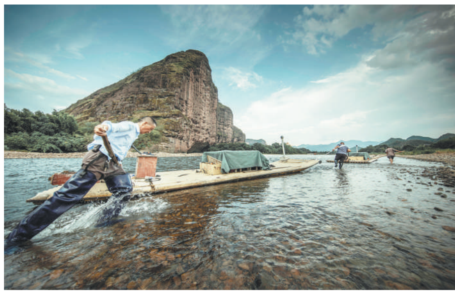
流经龙虎山的泸溪河仿佛一条逶迤的玉带，串联起了两岸的奇峰怪石、茂林修竹。

窑火不仅照亮了瓷都，更映照了整个赣鄱大地。从陶阳里的青砖黛瓦出发，建行江西省分行以点带面、精准发力，将金融活水引入全省文旅产业，共同绘就“诗和远方”的江西画卷。