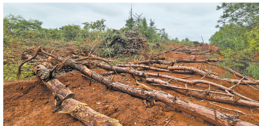
山上随处可见被滥伐的树木。

林木树种、面积、立木蓄积及规格等情况进行鉴定。6月1日公布的司法鉴定结果显示,涂坊山山场滥伐森林蓄积24.62立方米。同时,群众反映的假借次林整治名义采伐跑马山林木的问题,经调查,该山场存在一定超强度采伐的情况,超强度采伐蓄积以司法鉴定为准。