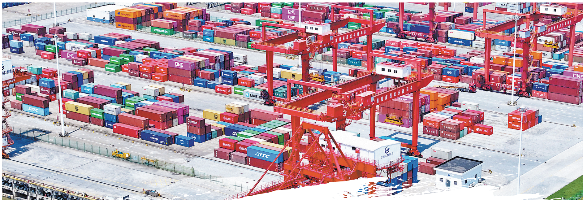
▲4月26日,位于南昌经开区内的龙头岗综合码头一片忙碌景象,货车来回穿梭装卸集装箱。