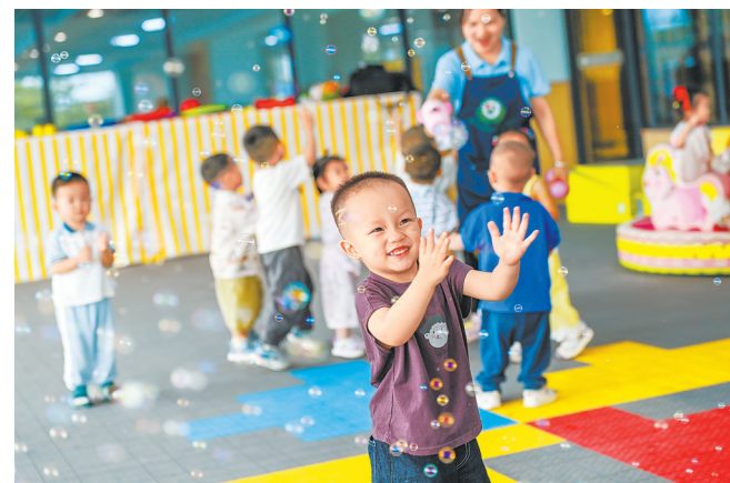
6月8日，丰丰县启智教育托育中心的小朋友在老师陪伴下快乐地玩耍。近年来，该县加快构建普惠托育服务体系，着力打造“15分钟托育服务圈”，受到群众欢迎。