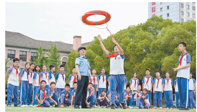
6月9日，南昌市育新学校教育集团北京西路校区邀请派出所民警走进校园，开展防溺水安全宣讲，通过互动教学，帮助孩子们掌握自救技能。

根据要求，在日常监管协同方面，住建部门在消防验收、备案抽查中发现不合格消防设备或消防技术服务机构违法线索，将及时函告或移交当地消防救援机构处理；消防救援部门每年至少开展一次建设工程消防产品抽样检验，住建部门全程协助配合。两部建立信息共享机制，形成监管合力。在建设工程消防验收（备案）协同方面，住建部门开展现场检查需测试消防车道、登高操作场地等救援事项时，至少提前3个工作日书面函告消防救援部门；验收备案完成后每季度不少于一次函告相关情况，消防救援部门同步每季度反馈公众聚集场所开业前消防安全检查信息，实现许可、验收、监管无缝衔接。在业务能力协同方面，两部每年至少组织一次联合业务培训，提升监督业务水平。在会商评估协同方面，对政策标准理解分歧等问题，5个工作日内启动会商并形成书面记录；定期评估协同机制运行效果，及时解决新问题、完善制度内容。