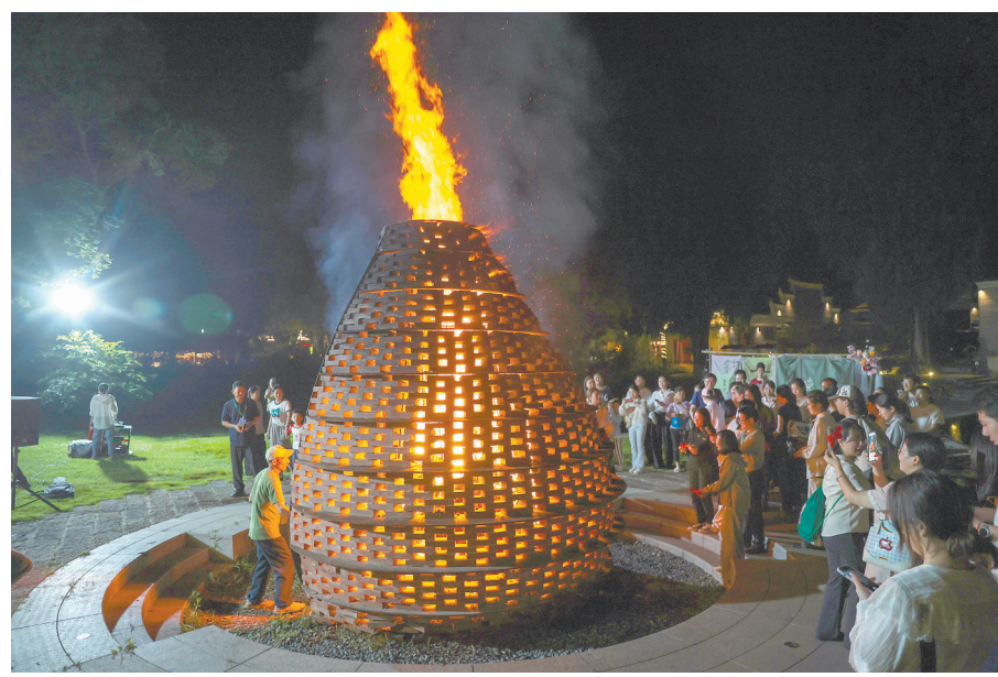
游客参与烧塔祈福活动。

古村藏古韵，书院续文魂。嘉宾们还走进白鹭洲书院，参观江西书院文化图文展及白鹭洲书院专题展览，细细品读千年