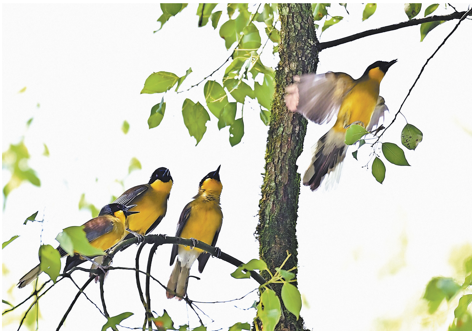
5月18日,婺源县太白镇曹门村一棵樟树上,4只蓝冠噪鹛正在枝头嬉戏。