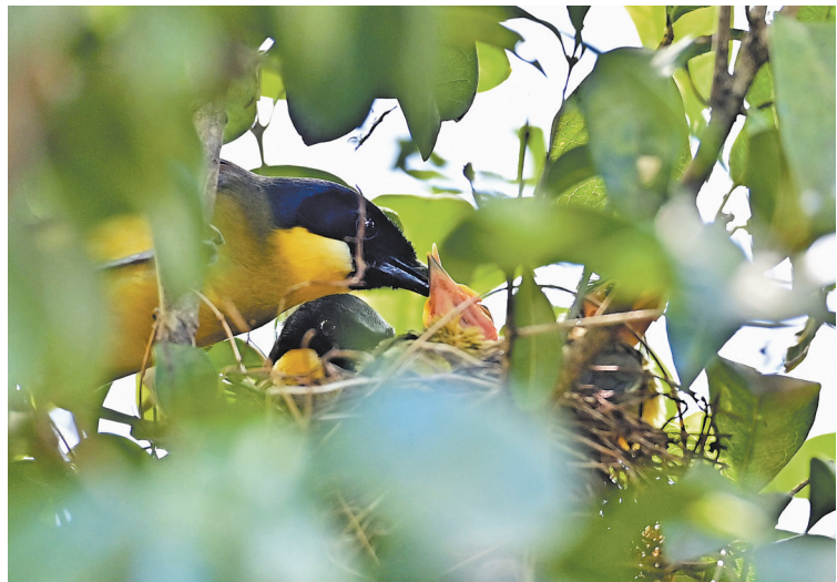
5月18日,婺源县太白镇曹门村,蓝冠噪鹛亲鸟正在给雏鸟喂食。