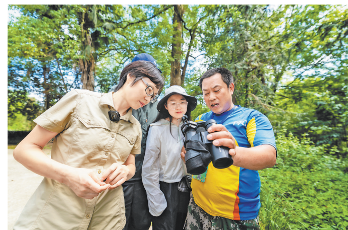
5月18日,婺源县太白镇程家湾村的山林里,江西农业大学林学院教授张微微(左一)带着学生驻扎野外,向当地护鸟员了解蓝冠噪鹛近期的活动情况。