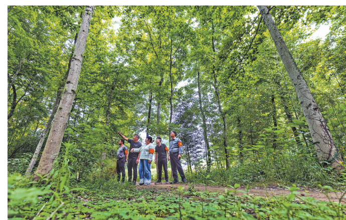
4月28日,德兴市新岗山镇的山林里,镇村干部和护鸟志愿者观察蓝冠噪鹛的栖息情况。