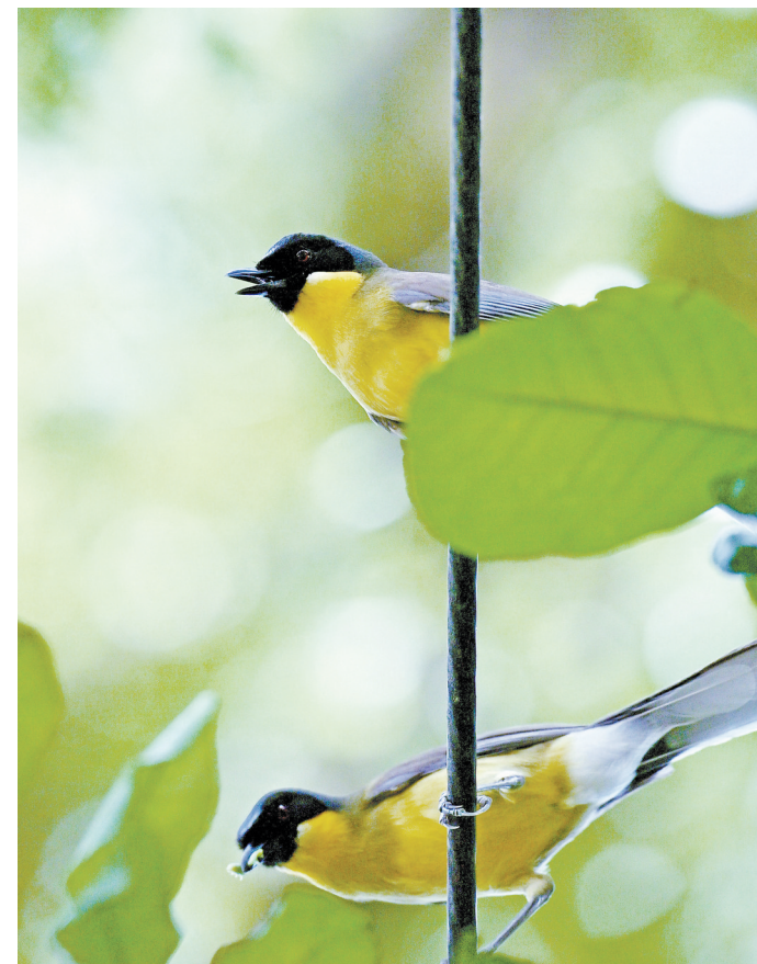
蓝冠噪鹛是中国特有鸟种、国家一级重点保护野生动物,喜食昆虫,也吃蚯蚓、野生草莓、野杉树籽等。