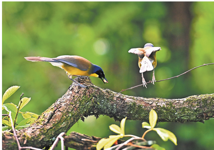
5月18日,婺源县太白镇曹门村,两只蓝冠噪鹛正在觅食。