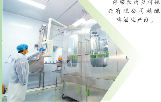
浮梁获湾乡村振兴有限公司精酿啤酒生产线。