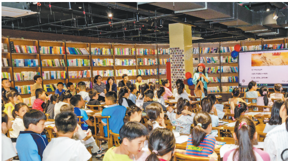
6月16日,一场以端午文化为主题的亲子活动在瑞昌市华夏书城举行。活动设置了包粽子、读美文、知识问答、分享端午故事等环节,将传统民俗与书香文化结合,提升市民的阅读兴趣。