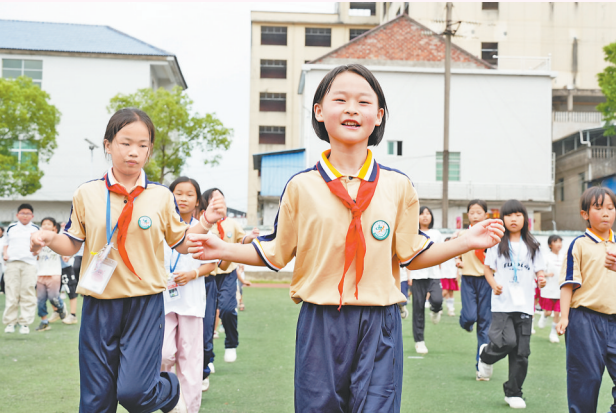
学生们参与“趣味特色大课间”活动。

目前,县教体局正通过观摩评比、资源共享等方式推广该经验,鼓励各校融入本土文化与体育项目,让活动内容常新、魅力持久。如今,在万年的校园里,课间已成为释放活力、培养兴趣、学习协作的“第二课堂”。