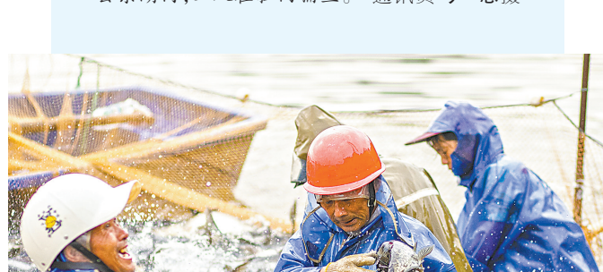
▼近年来,都昌县依托水资源禀赋,推行“人放天养、放鱼养水、以鱼净水”养殖模式,实现生态效益与经济效益双提升。图为6月17日,该县东湖内,工人在拉网捕鱼。