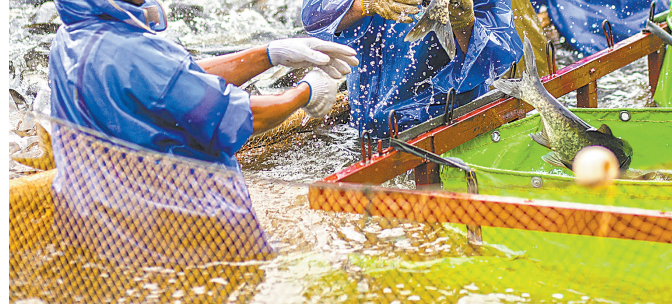
▼近年来,都昌县依托水资源禀赋,推行“人放天养、放鱼养水、以鱼净水”养殖模式,实现生态效益与经济效益双提升。图为6月17日,该县东湖内,工人在拉网捕鱼。