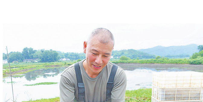
▲6月17日,在宁都县钓峰乡东山下村“稻虾共生”养殖基地,村民忙着收获、分选、装运小龙虾,保障市场供应。

近年来,客家文化(赣南)生态保护区积极推动“非遗+旅游”“非遗+乡村振兴”等项目,推出“客家新赣线 围屋印象”等主题文旅线路,其中“赣南非遗美食之旅”入选全国特色旅游线路,保护区入选“长江非遗体验之旅”。数字化保护同步推进,已完成391项市级以上非遗项目信息入库,上线非遗慕课826堂,归集客家纹样5000余件并完成数字版权登记。