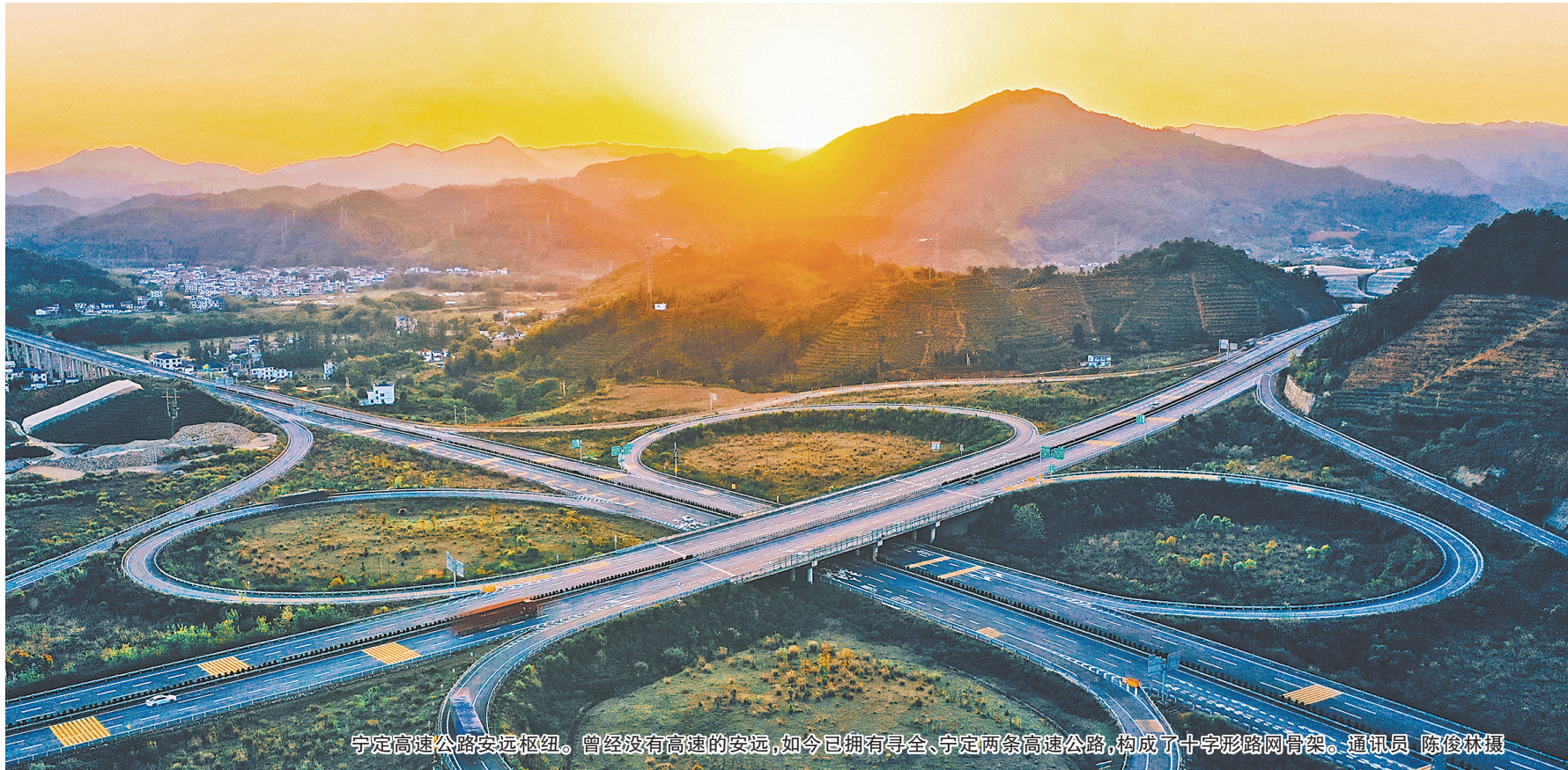
宁定高速公路安远枢纽。曾经没有高速的安远，如今已拥有寻全、宁定两条高速公路，构成了十字形路网骨架。

深耕特色办学以来，该校先后荣获“全国青少年校园足球特色学校”“全国青少年校园篮球特色学校”称号，并成功打造了“青少年门球实践基地”。在全省家校社协同育人“教联体”典型案例征集活动中，该校撰写的《三球融通促成长“五育”并举育新人》入选典型案例。