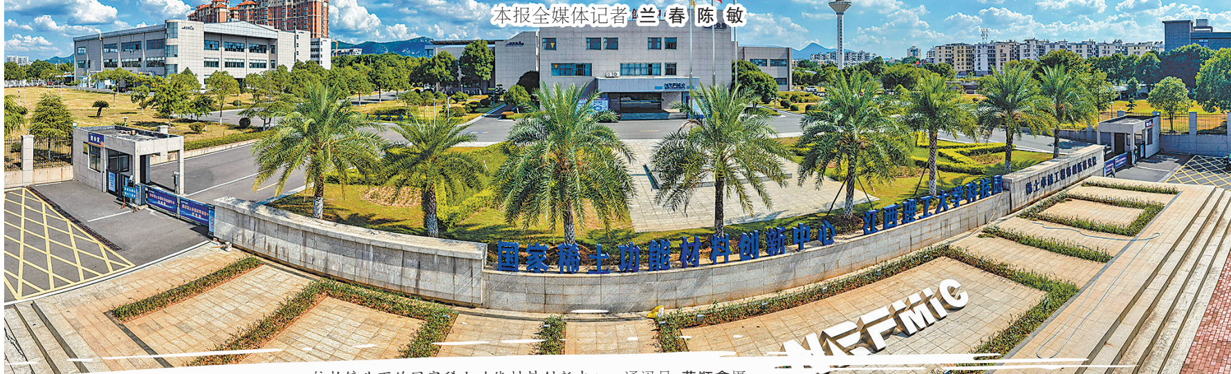
航拍镜头下的国家稀土功能材料创新中心。

仲夏赣南，层峦叠翠，万象勃发。山河铭记峥嵘。赣州是原中央苏区核心区域，为中国革命作出重大贡献、付出巨大牺牲，厚重的红色底蕴滋养着这片热土的振兴蝶变。