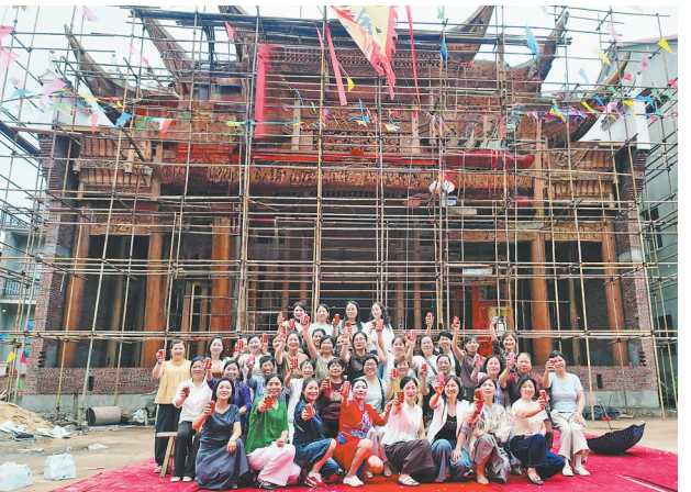
村民在新戏台前合影。

于传统木结构建筑文化而言,上梁不是一道普通工序,而是乡民敬天地、祀先祖、祈家宅兴旺的庄重仪式。当日,村内鼓乐齐奏,鞭炮声声。主事人依照传统习俗高声祈福,仪式庄重。最让氛围感拉满的,当属世代相传的抛梁礼。随着主事人一声呼喝,糖果、喜烟自高粱之上撒下,台下男女老少争相承接,欢声笑语此起彼伏。