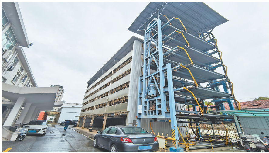
南昌机械厂小区立体停车库遭弃用,车辆停在库外。

而在南昌市,多个立体停车库同样陷入闲置困境。红谷滩羽毛球馆立体停车库被贴上了封条,西站华府楼盘立体停车库闲置,投资近4000万元的青山湖区塘南村立体停车库建成多年未投入运营,京东镇