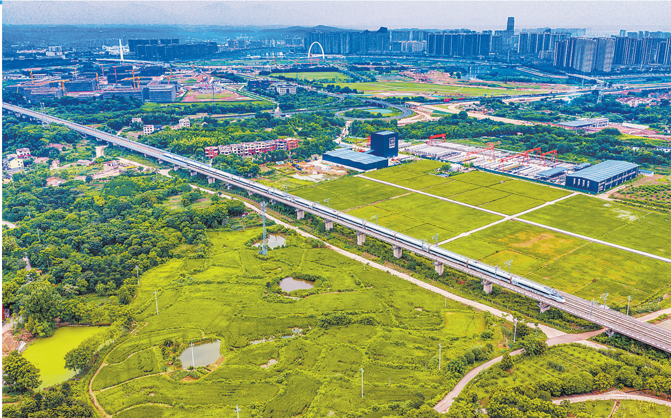
6月27日，列车行驶在杭台高铁浙江嵊州境内的路段上（无人机照片）。