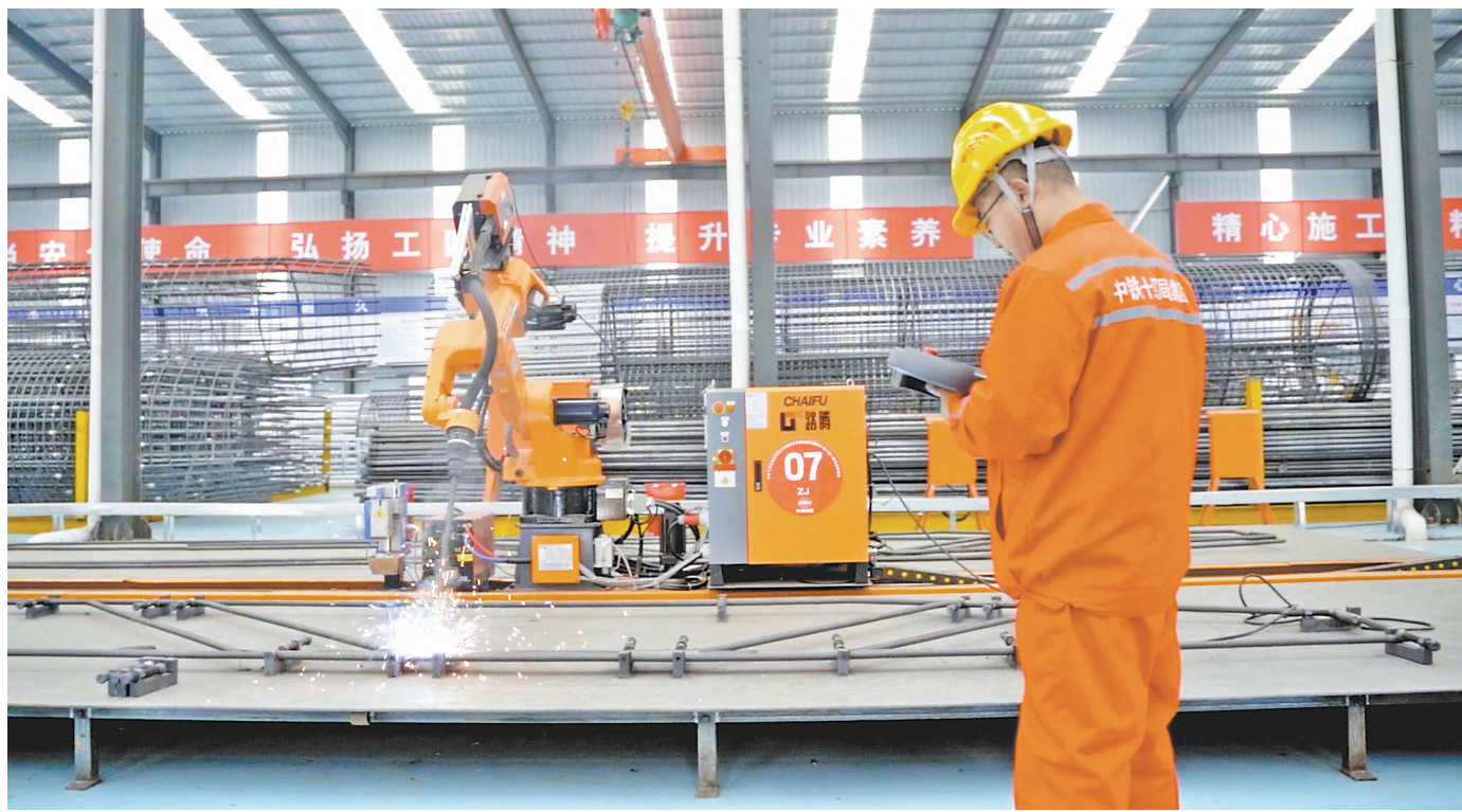
自动焊接机器人正在作业。

仲夏时节,驱车沿樟吉高速行驶,沿线施工点机械轰鸣,建设正酣。作为我省高速公路主骨架的纵向主干道,樟吉高速改扩建项目全长约105公里,总投资121亿元,由双向四车道扩建为双向八车道,建成后将成为北接长江中游城市群、南进粤港澳大湾区的快速新通道。 近日,记者走进由中铁十四局承建的A1标。这条交通动脉不仅承载着畅通赣鄱的使命,更成为稳就业、惠民生的载体。项目通过岗位扩容、技能提升、服务配套“三管齐下”,让重大工程真正成为就业蓄水池和人才孵化器。