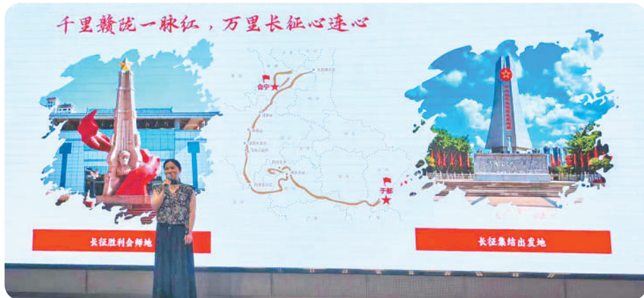
2026“如画江西 风景独好”江西文化和旅游(兰州)推介会现场