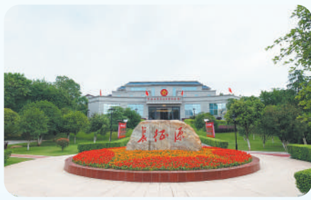
中央红军长征出发纪念馆